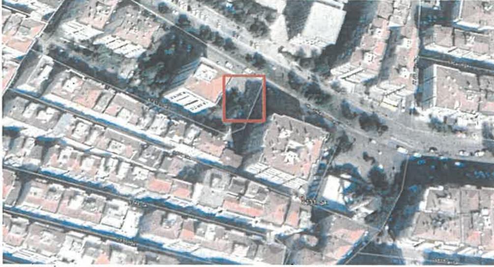
Şekil 1: İmar planı Değişikliği Alanının Uydu Görüntüsü

İmar Planı Değişikliğine konu olan, İzmir İli, Karşıyaka İlçesi, Şemikler Mahallesi, 25L-2C Nolu imar paftasında bulunmaktadır. 6131/2 Sokak ile Gün SAZAK Bulvarının birleştiği yeşil alanda (Yeraltına konabilir.) 6.00x4.00 ebatlı, 24 m 2 yüzölçümlü trafo konumlandırılmıştır.